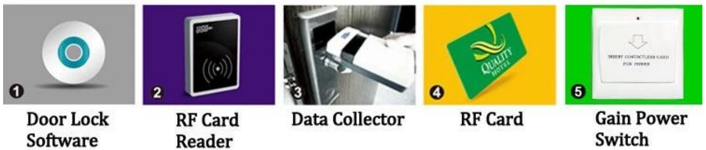
1 Door Lock Software