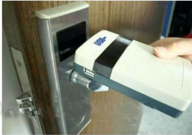
collect opening records from hotel lock