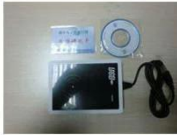
RF card reader (used for issuing room card to guests)