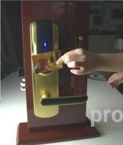
opening the door with RF card