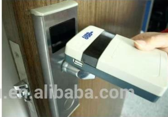
collect opening records from hotel lock