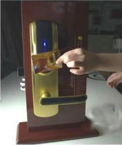
opening the door with RF card