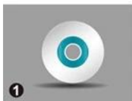
1 Door Lock Software