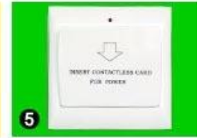
5 Gain Power Switch