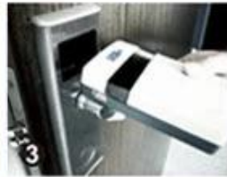
3 Data Collector