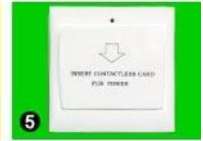
5 Gain Power Switch