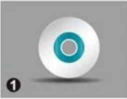
1 Door Lock Software