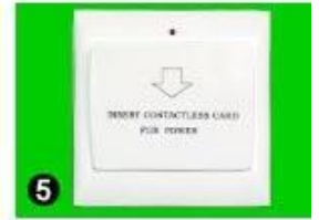
5 Gain Power Switch