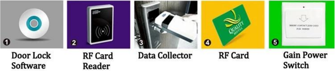
1 Door Lock Software