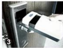
3 Data Collector