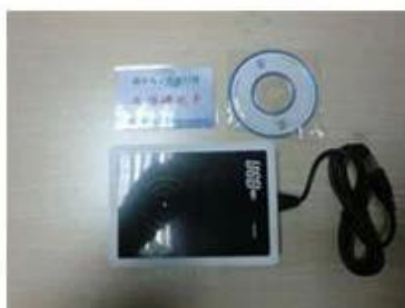
RF card reader (used for issuing room card to guests)