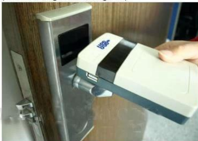
collect opening records from hotel lock