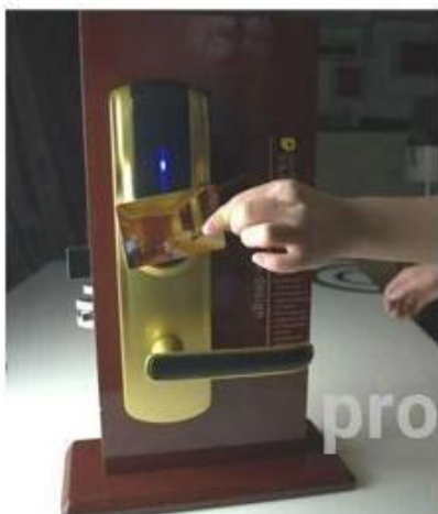
opening the door with RF card