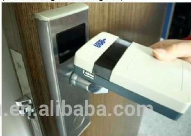
collect opening records from hotel lock