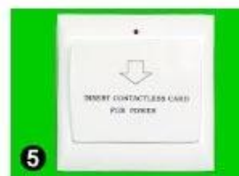
5 Gain Power Switch