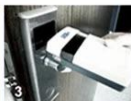
3 Data Collector