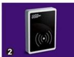
2 RF Card Reader