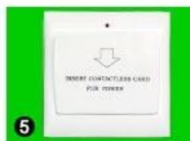
5 Gain Power Switch