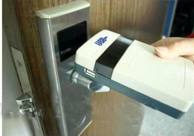
collect opening records from hotel lock

Hoog beveiligingsniveau hotel sleutelkaarten lock fabriek