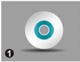
Door Lock Software