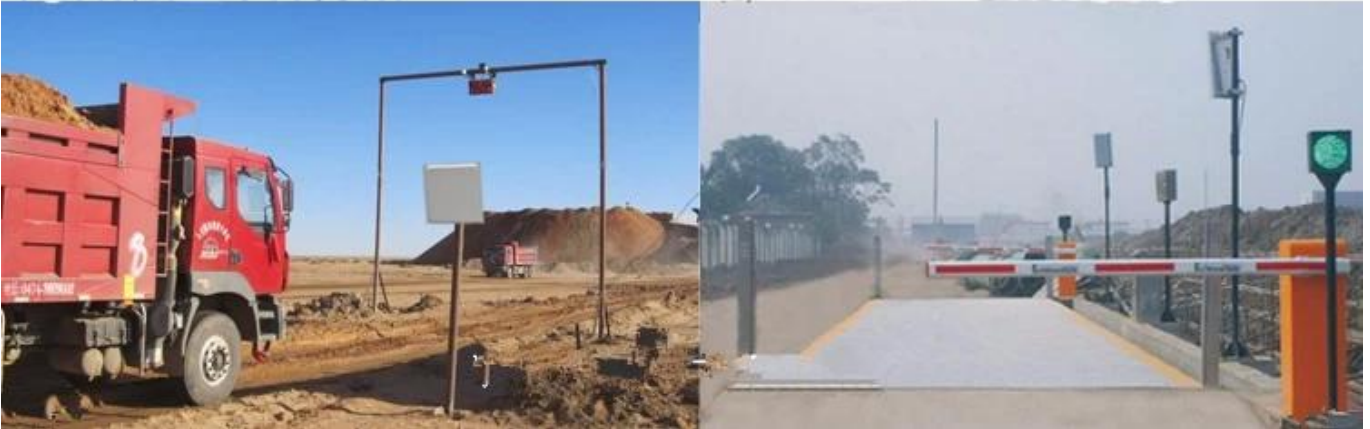
Uhf rfid lezer module prijs lees andere UHF kaarten