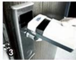
3 Data Collector