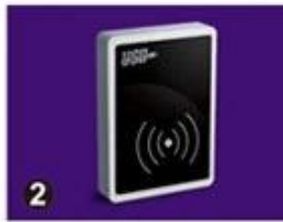
2 RF Card Reader