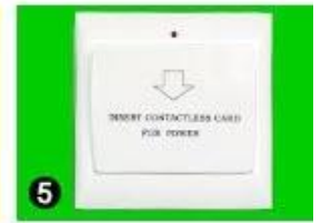
Gain Power Switch