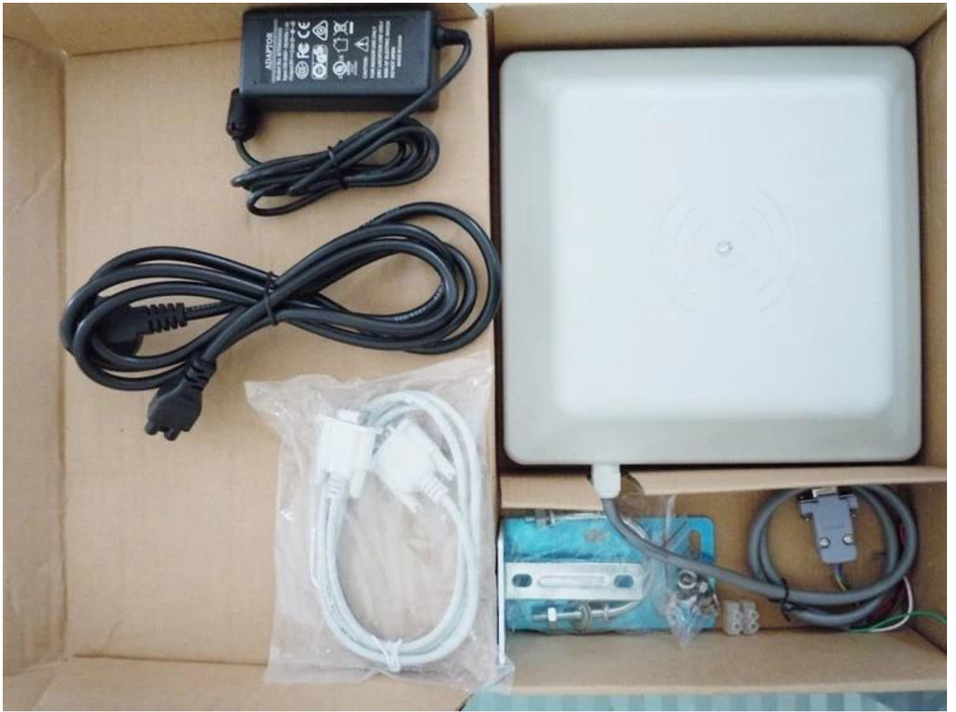
Uhf rfid reader module price installation on site