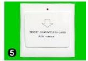
5 Gain Power Switch