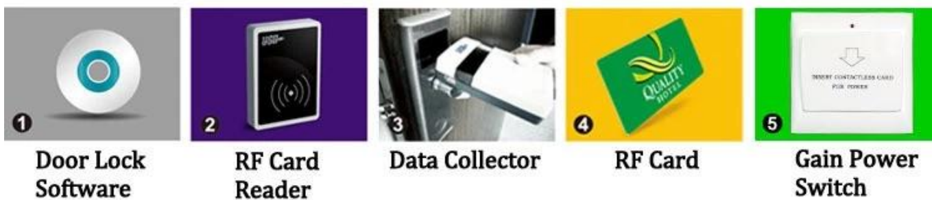
Door Lock Software