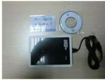
RF card reader (used for issuing room card to guests)