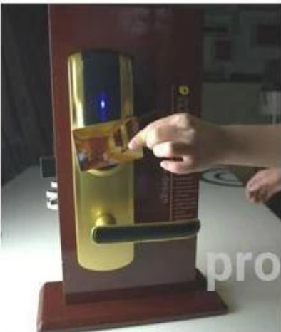
opening the door with RF card