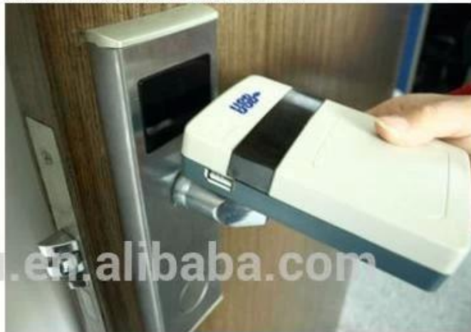
collect opening records from hotel lock