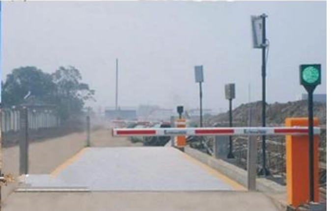
UHF RFID Reader 〇〇〇〇〇〇〇〇〇〇〇〇〇〇〇〇〇〇 UHF 〇〇〇〇 〇